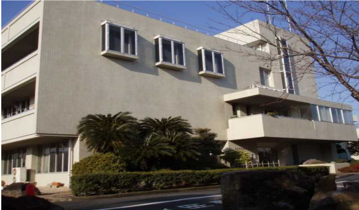
岡山県南部水道企業団 庁舎