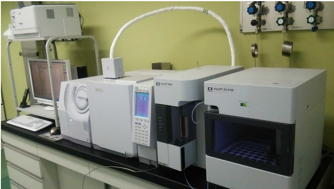
ガスクロマトグラフ質量分析装置